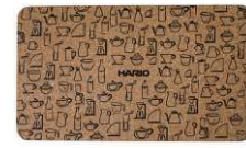
CMT-K 宽 190 ・ 深 110 ・ 高 10 W 190 ・ D 110 ・ H 10 C/T 10 × 30