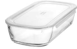
KSTL-140-TW 宽 270 ・ 深 145 ・ 高 62 W 270 ・ D 145 ・ H 62 1,400ml C/T 12 (6 × 2) 产品无包装