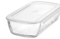
KSTL-90-TW 宽 238 ・ 深 125 ・ 高 56 W 238 ・ D 125 ・ H 56 900ml C/T 12 (6 × 2) 产品无包装