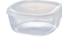
KST-60-TW 宽 143 ・ 深 139 ・ 高 62 W 143 ・ D 139 ・ H 62 600ml C/T 24 (6 × 4) 产品无包装