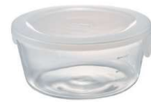
SYTN-120-TW 宽 170 ・ 深 168 ・ 高 78 口径 160 W 170 ・ D 168 ・ H 78 top opening diameter 160 1,200ml C/T 36 (6 × 3 × 2) 产品无包装