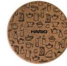
CMT-M 直径 100 × 高 10 φ 100 × H 10 C/T 10 × 60